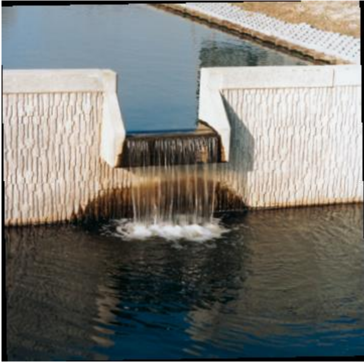
Keerwandstuw. Hoogteverschil niet regelbaar. Vaste overstort.