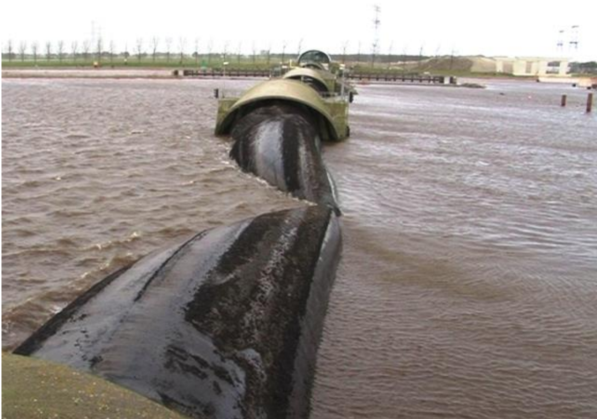
Balgstuw, middels lucht (kan opgeblazen worden voor aanvang afsluiting)