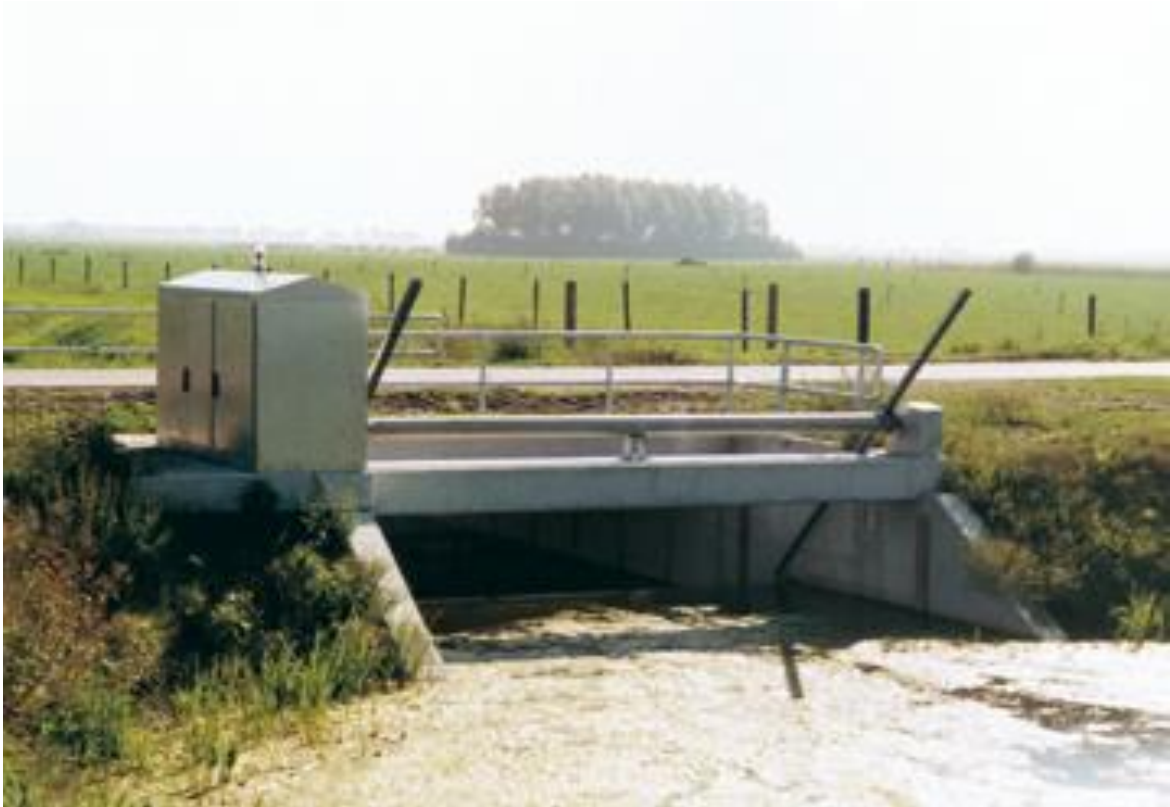
Gronddamstuw met klepstuw