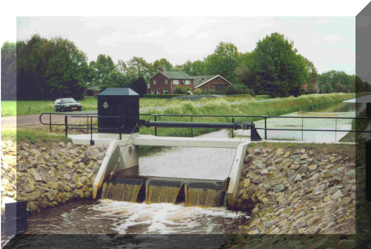
Klepstuw, in hoogte verstelbaar via computer. Klep kan kantelen.