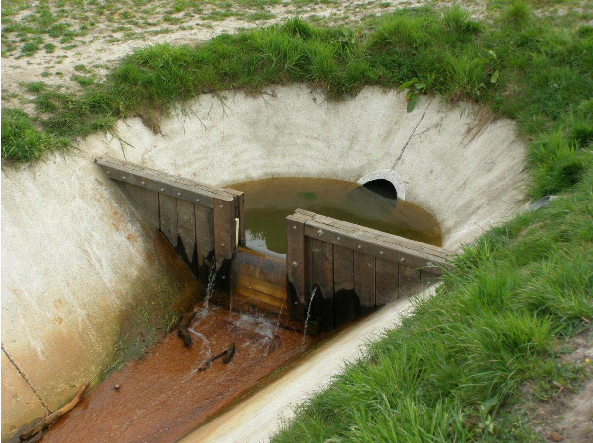
Schotbalkstuw, afsluitbaar met houten balken. Waterstand in hoogte handmatig verstelbaar door houten balken toe te voegen of deels te verwijderen.