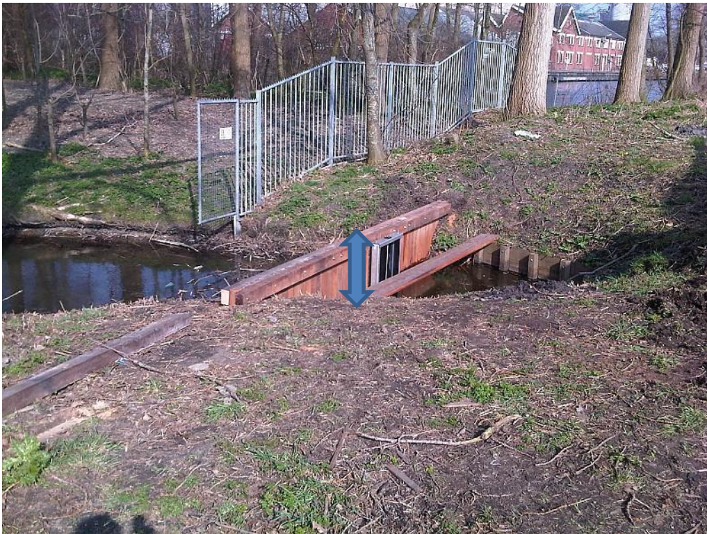
Inlaatstuw in hoogte regelbaar, van boven naar beneden verstelbaar (verticaal) en afsluitbaar. Kan watergang volledig afsluiten.